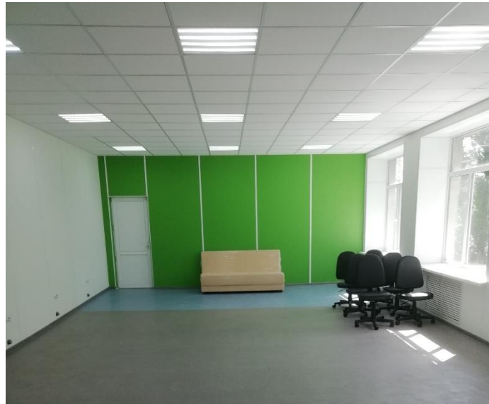
МКОУ Парижскокоммунская СОШ Верхнехавский р-н