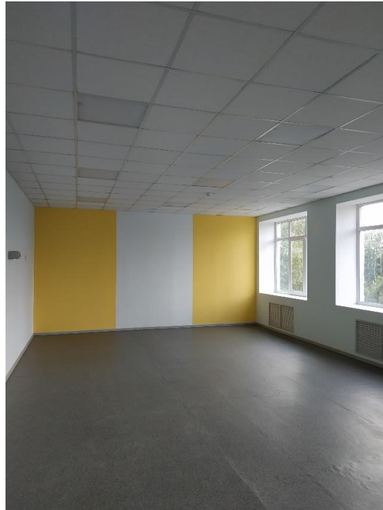
МКОУ Трехстенская ООШ Каменский р-н