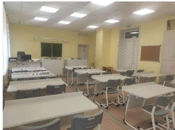
МКОУ Манинская СОШ Калачеевский р-н